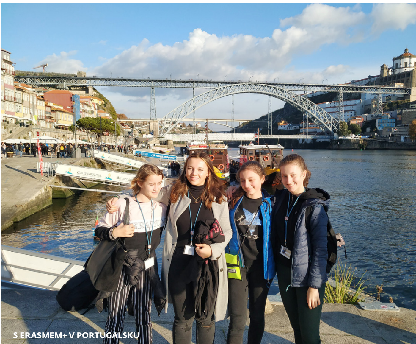
S ERASMEM+ V PORTUGALSKU

V listopadu se vybraní žáci ze tříd 7. B a 9. B naší školy zúčastnili první mobility v projektu „Peer Bullying and Alternative Solutions in a European Dimension“ (Šikana mezi vrstevníky a její řešení v evropském měřítku) v partnerském portugalském městě Aveiru.