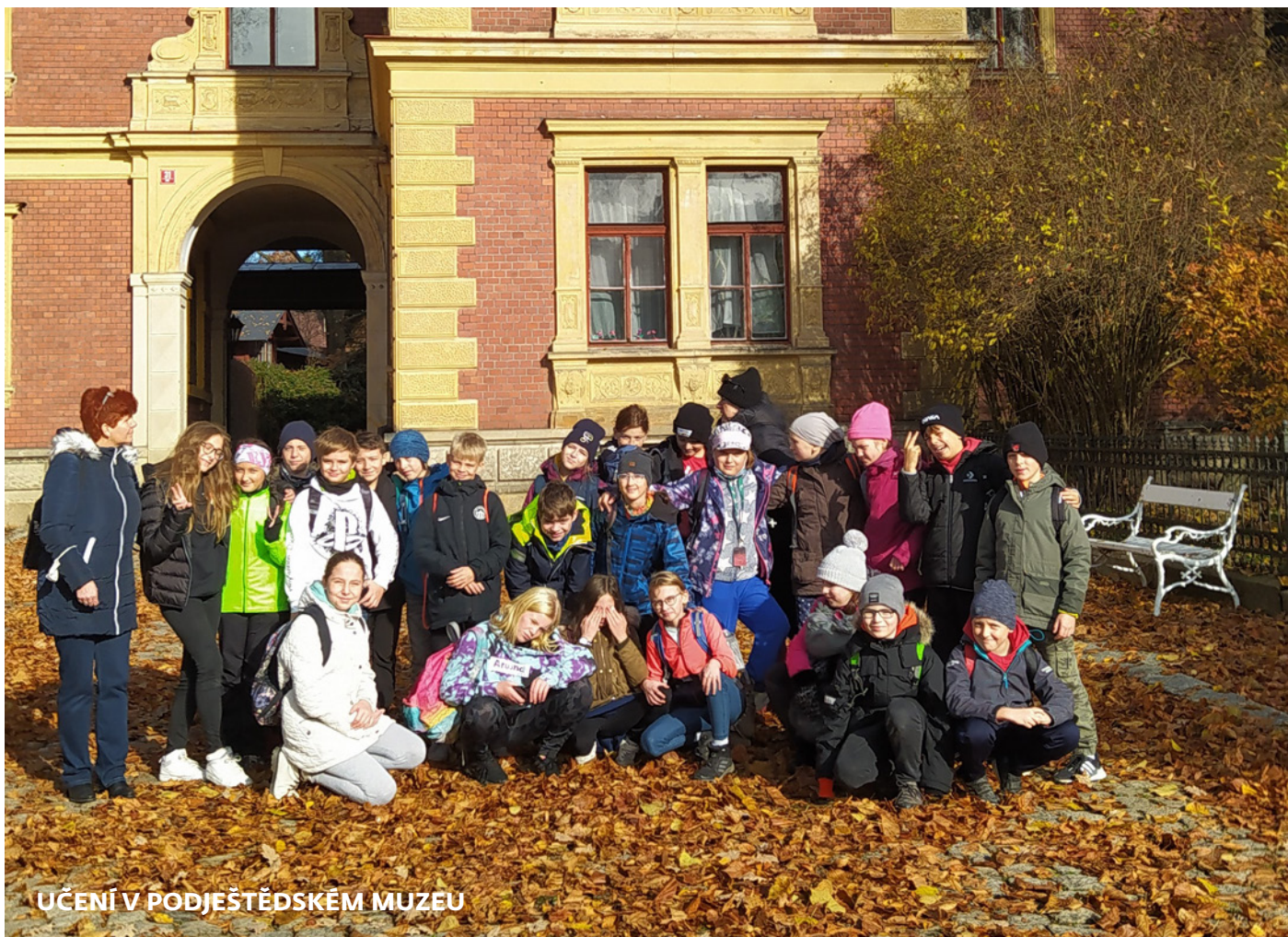
UČENÍ V PODJEŠTĚDSKÉM MUZEU

V rámci výuky vlastivědy jsme se na začátku října vydali do Českého Dubu. Kde jinde učit dějiny než přímo na místech, kudy dějiny kráčely.