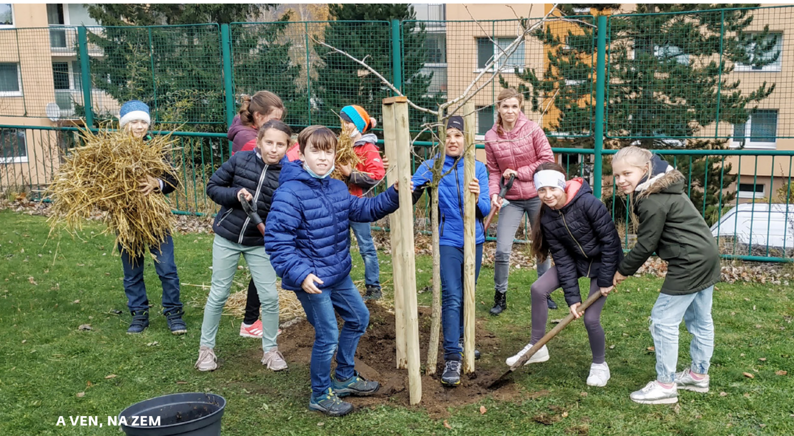
A VEN, NA ZEM

Projekt revitalizace zahrady při ZŠ Aloisina výšina pod názvem A ven, na Zem, je podpořen SFŽP, MML a také Libereckým krajem, díky kterému ZŠ Aloisina výšina revitalizuje prostory své školní zahrady.