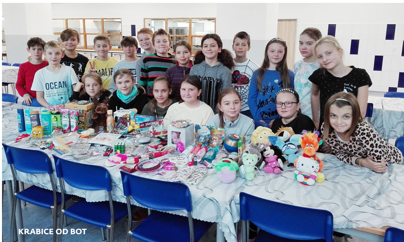
KRABICE OD BOT

Období adventu a Vánoc je mimo jiné i příležitost k dobrým skutkům a právě této příležitosti využily děti z 2. stupně ze Základní školy náměstí Míru v Liberci. Již druhý rok se zapojily do akce Krabice od bot, která spočívá v možnosti darovat dárečky zabalené v krabici od bot dětem, které je potřebují.