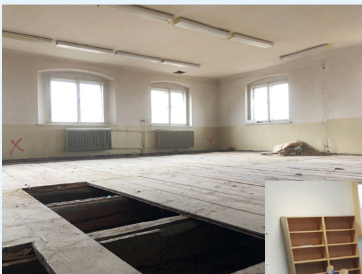
Učebna přírodních věd před rekonstrukcí a po ní

Slavnostní otevření budov proběhne 28. ledna 2020 za přítomnosti vedení města a stavebních firem. Ve stejný den od 16.00 hod. plánujeme den otevřených dveří pro naše rodiče a další veřejnost, na který vás srdečně zveme.